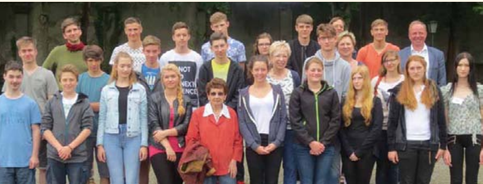
Die Klasse 10a vom Richard-Wossidlo-Gymnasium Waren/Müritz bei den Begegnungstagen des Landtages in der Mahn- und Gedenkstätte Ravensbrück.