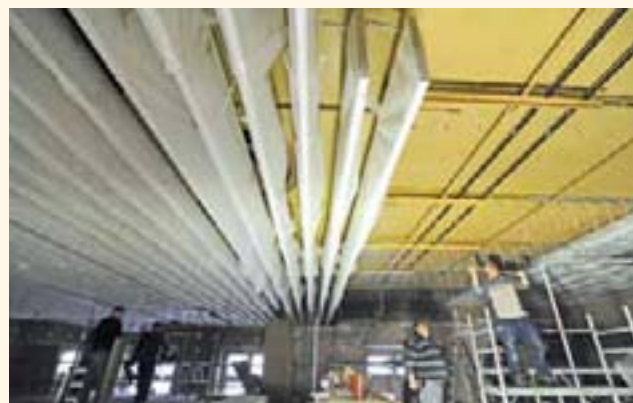
Zur Steuerung des Raumklimas wurden in die Decke des neuen Plenarsaals Kühllamellen eingebaut, durch die die goldene Decke hindurch schimmert.

Neben der Sanierung der Wände waren Decke und Fußboden die vordringlichsten Baustellen. Es mussten massive Stahlträger eingebaut werden, denn die Decke spannt sich stützenfrei über 20 Meter von Seitenwand zu Seitenwand.