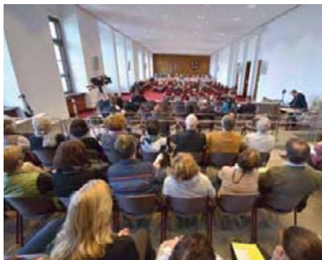
Blick von der Besuchertribüne ins Plenum

„In den letzten neun Jahren haben die Ministerien unglaublich viele Milliarden Euro in die Hand genommen, um dieses Land voranzubringen“, unterstrich der CDU-Abgeordnete Lorenz Caffier. „Es wurde investiert, es wurde gebaut, es wurde gefördert.“ Die Ergebnisse könne man „allerorts“ sehen – man müsse es nur wollen. „Es ist schmerzlich für die Opposition, solche Entwicklungen anzuerkennen.“ Es gebe im Parlament „viele Abgeordnete“, die glaubten, dass der Staat viel regeln müsse, und auch jene, die „möglichst alle Vorschriften und Steuern abschaffen wollen“. Die Vergangenheit lehre, dass beides „in Sackgassen“ führe. „Das Erfolgsmodell, für das die Wirtschaftspolitik dieser Landesregierung steht, ist der Weg der Mitte: die soziale Marktwirtschaft.“ Der Aufstieg des Landes hänge in vielen Punkten von diesem Weg ab: von der Freiheit der Unternehmer, intelligenten Förderungen, einem konsequenten Ausbau der Infrastruktur, guter Bildung und soliden Finanzen. „Genau das, lieber Herr Holter, ist auch das Rezept für die kommenden Jahre, um weiter voranzukommen in diesem Land.“