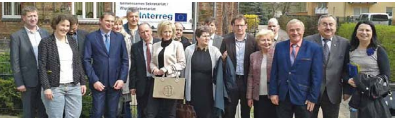
Die Bildungsausschüsse des Landtages M-V und des Sejmiks Westpommern vor dem Gebäude der Kommunalgemeinschaft Europaregion POMERANIA in Löcknitz.