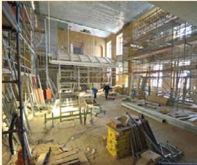
Der künftige Plenarsaal nimmt langsam Formen an.