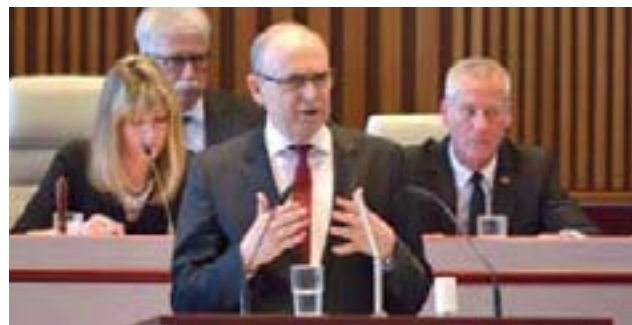
Ministerpräsident Erwin Sellering