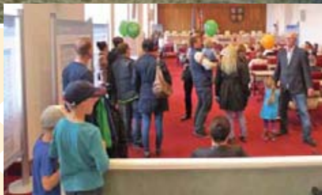
Eine Stippvisite im Plenarsaal gehört für die meisten Besucher unbedingt dazu.

Wählen können alle – auch Touristen, auch Kinder und Unter-18-Jährige – aber auch schon am 19. Juni: nämlich aus dem vielfältigen Informations- und Unterhaltungsangebot beim traditionellen „Tag der offenen Tür“ des Landtages. Geboten wird viel mehr als nur ein Blick hinter die Kulissen des Landesparlaments, zumal mit dem Schloss auch der schönste Landtagsitz Deutschlands und UNESCO-Welterbe-Kandidat seine Pforten öffnet.