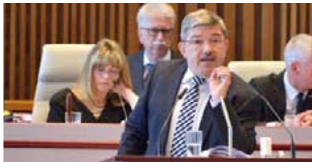
Lorenz Caffier (CDU)

in Armut lebten und immer mehr Senioren auf Wohngeld angewiesen seien. Doch anstelle „Korrekturmaßnahmen einzuleiten“, stelle die „politische Elite“ im Land „den eigenen Opportunismus und schnöde Parteiinteressen in den Vordergrund“. Sein Fazit: „Es hat sicherlich Verbesserungen hier im Land gegeben. Aber nicht aufgrund der Arbeit der Landesregierung seit 1990, sondern trotz der Landesregierung seit 1990.“