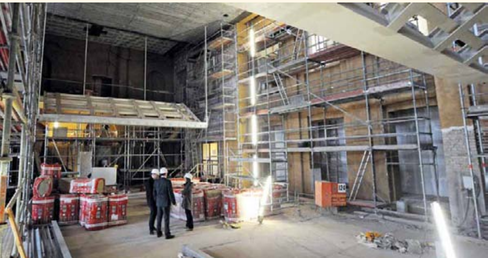
Das Raumgerüst wurde bereits abgebaut, die Stahlkonstruktionen für die Zuschauertribünen sind schon eingebaut.