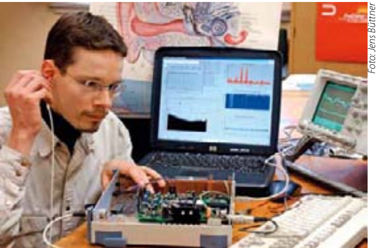
Ein Diplomabschluss ist bei vielen Studierenden begehrt.

von höchstrichterlicher Instanz bestätigt.“ Das Urteil beziehe sich zwar nur auf Nordrhein-Westfalen. „Allerdings wird dieses Urteil auch auf uns Strahlkraft entfalten“, sagt Liskow unter Verweis auf die Fachhochschule Stralsund, die wegen der Nichtakkreditierung des Diploms für den Studiengang „Internationales Wirtschaftsingenieurwesen“ bereits Klage beim Verwaltungsgericht Greifswald eingereicht hatte.