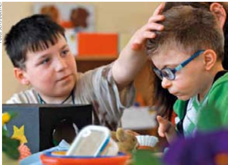
Kinder mit und ohne Behinderung sollen häufiger gemeinsam lernen.

zess nur fraktionsübergreifend gestalten können.“ Mit dem „Inklusionsfrieden“ sei es SPD, CDU und Linken gelungen, „verlässliche Rahmenbedingungen über die laufende Wahlperiode hinaus“ zu schaffen. Für bauliche Voraussetzungen stünden dazu aus EU-Förderprogrammen mindestens 15 Millionen Euro aus EFRE-Mitteln und bis 35 Millionen Euro aus dem ELER-Programm zur Verfügung. „Zusätzliche 20 Millionen Euro sind im Doppelhaushalt eingestellt.“ Hinzu kämen 237 zusätzliche Lehrstellen. Er könne nachvollziehen, dass die angestrebten Veränderungen auch „Ängste und gewisse Vorbehalte“ hervorriefen. Butzki kündigte jedoch an, Schulen, Schulträgern, Eltern und Schülern bei der praktischen Umsetzung zur Seite zu stehen. „Ich bin davon überzeugt, dass wir im Jahr 2023 feststellen werden, dass dieser gemeinsame Weg der richtige war.“