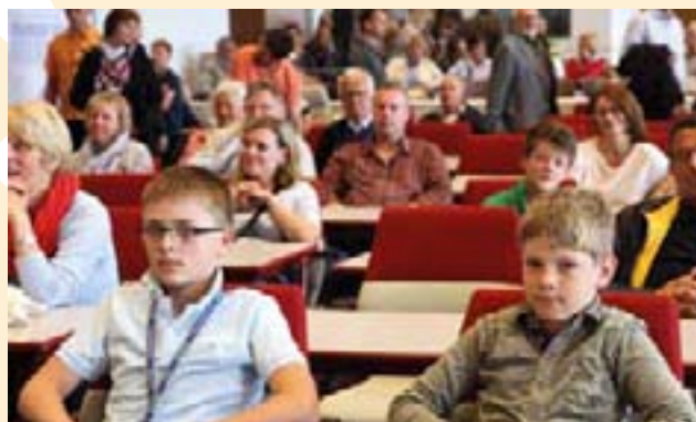
Die Abgeordneten-Stühle laden zum Probesitzen ein – die Gesprächsthemen zum Bleiben.