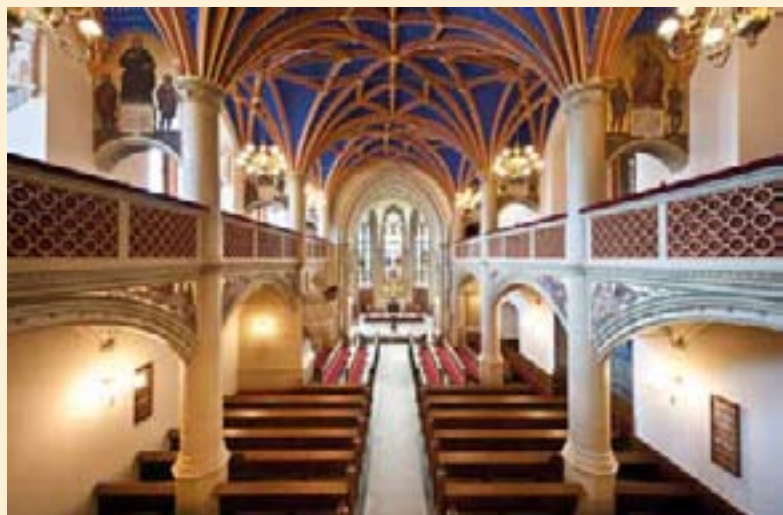
Die Schlosskirche lädt ab 10 Uhr zur Besichtigung ein.

Die Wohn- und Festräume des Großherzogs mit Thronsaal und Ahnengalerie, dem früheren Waffensaal Hofdornitz, der neu eröffneten Silberkammer und der Porzellan-Ausstellung in den ehemaligen Kinderzimmern können besichtigt werden.