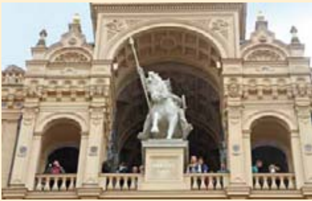
Für den Ausblick aus der Niklothalle nimmt man gern viele Treppen in Kauf.