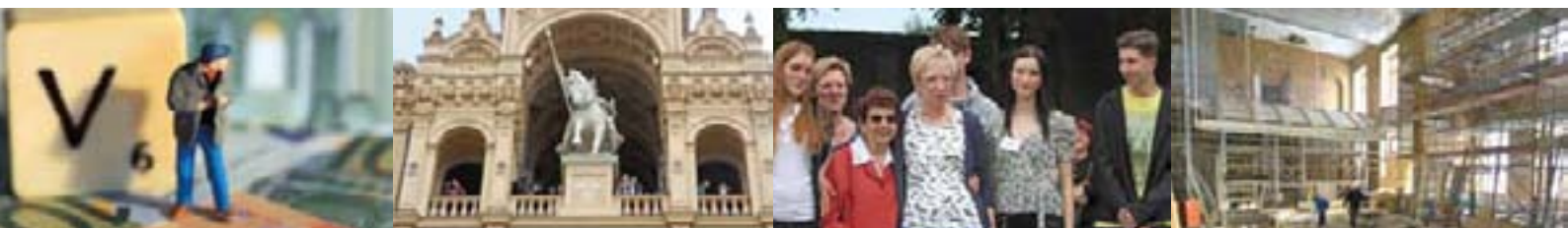
Südflügel des Schweriner Schlosses mit Hauptturm und Orangerie