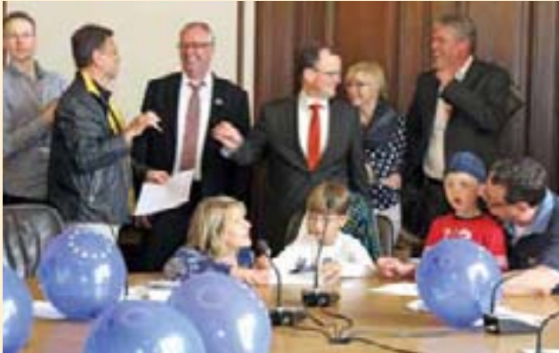
Auch die Fachausschüsse freuen sich über viele interessierte Besucherinnen und Besucher.